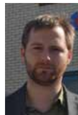
Jonas Rubrech PR & communicatie